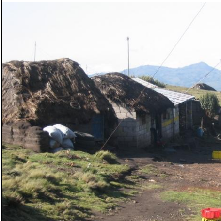
I mange av bygdene lever folk enkelt