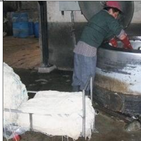
Vasking av garn