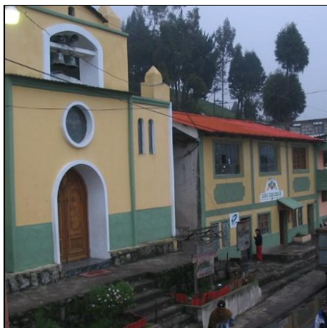
Kirka er sentrum i Salinas

Salinas har over et par - tre tiår opplevd en spesiell utvikling. Gjennom europeisk bistandsarbeid har man fått til gode samarbeidsformer og startet opp et utall fabrikker og verksteder. Fra å være et fraflyttingsområde med en saltgruve som tok slutt har det vokst fram et område for optimisme og vekst. Her blomstrer ideene og gründere finnes overalt. Ungdomsgruppa har gjort omvisning til sin spesialitet ved siden av hostel-driften. Du blir derfor tatt godt imot og i løpet av noen timer kan du besøke sjokoladefabrikken, spinneriet, pølseprodusenten, meieriet og ostefabrikken, utvinning av planteoljer, damene som strikker gensere, familien som lager fotballer eller noen av alle de andre verkstedene.