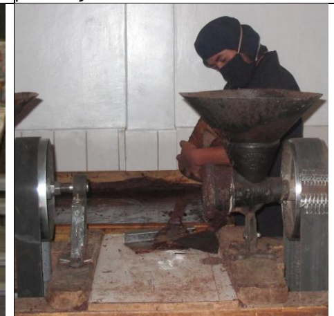
Mekanisk verksted for ulike reparasjoner