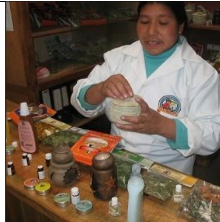
Oljer og urter lages av planer i Salinas