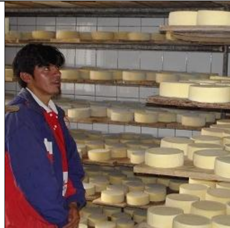
Omvisning på meieriet med lokal guide