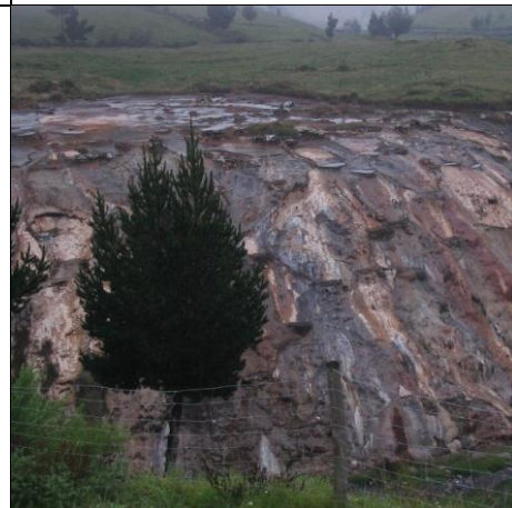
Vasking av salt er fortsatt mulig