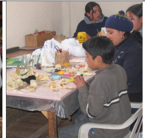
Ungdomsgruppa hjelper også til med produksjonen