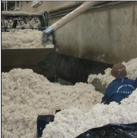
Sortering av ull