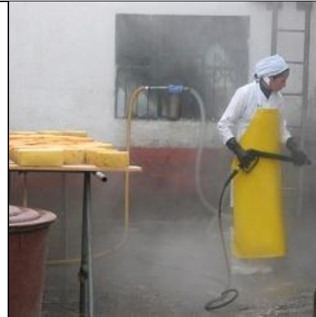
Meieriet er Salinas viktigste produksjon