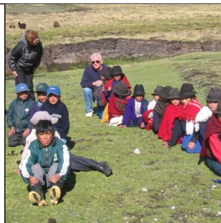
Skolebesøk på bygda ved Salinas