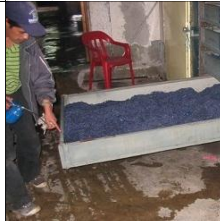
Farging av garn