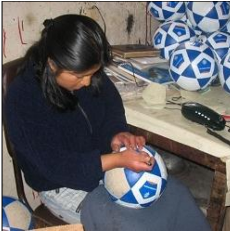
Fotballer lages for hånd