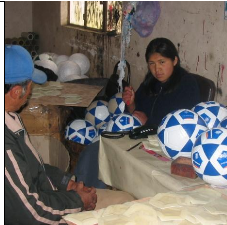
Et av de mange verkstedene