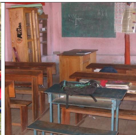
Inne på en bygdeskole i Salinas