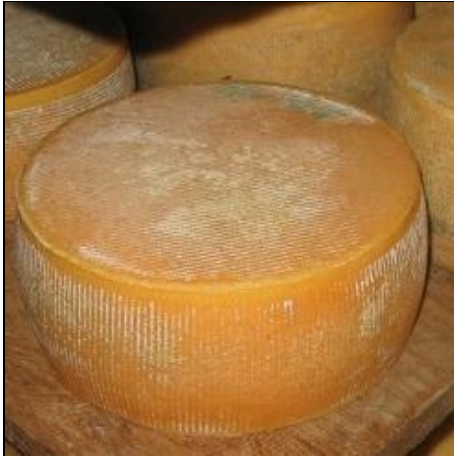
Osten er klar på lager