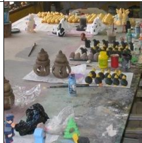
Keramikk lages for nasjonalt salg