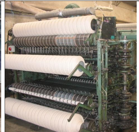
Spinning av tråd og bunting